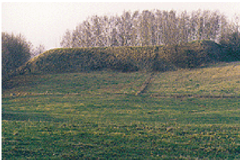
Fot. 1. Grodzisko staropruskie