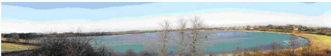
Fot. 3. Widok na Jezioro Węgielsztyńskie

Odosobnione położenie wsi – leży ona na półwyspie oddzielonym od zaplecza pasmem wzgórz z najwyższym wzniesieniem zwanym Lisową Górą 150 m n.p.m. – uchroniło ją całkowicie od klęski dżumy w latach 1709-1711. Węgielsztyn był wsią królewską. Posiadał młyn należący do skarbu państwa, obsługujący całą okolicę. Spis z 1858 r. stwierdził, że wieś miała obszar 62 włók i liczyła 728 mieszkańców. W 1939 r. mieszkały tu 592 osoby.