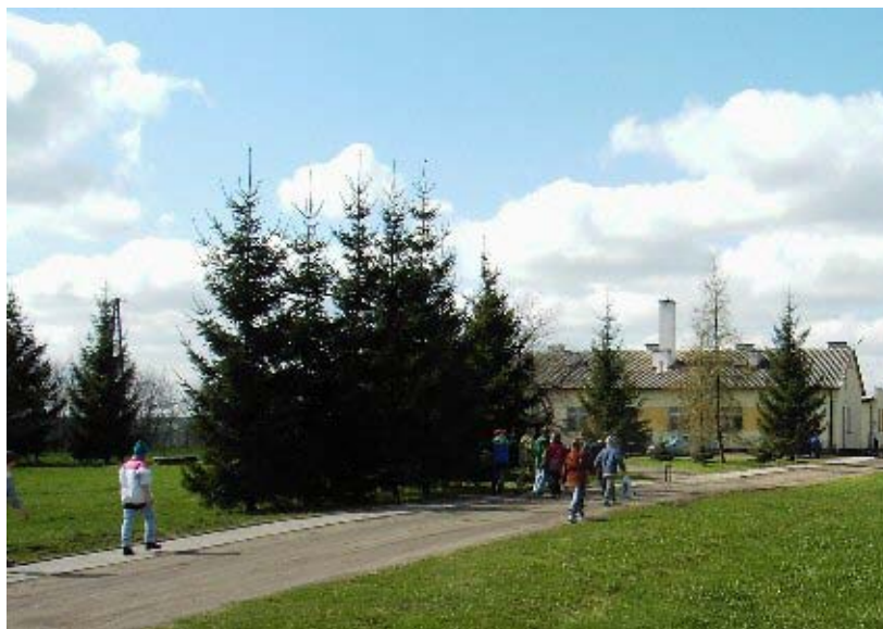
Fot. 7. Widok szkoły

Z miejscowością związane są legendy, które publikowane są w regionalnym czasopiśmie. Nazwa osady Węgielsztyn, to spolszczona nazwa niemiecka Engelstein. Pierwszą lokację, dokonaną w okolicach jeziora Rydzówka, wzmiankowano w roku 1400. Prawdopodobnie wieś została potem przeniesiona w obecne miejsce. Z faktem tym wiąże się odnowienie lokacji wsi w roku 1406. Przywilej lokacyjny wystawił ówczesny Marszałek Zakonu Krzyżackiego- Ulryk von Jungingen, pod datą 6 września 1406, na podstawie przepisów prawa chełmińskiego.