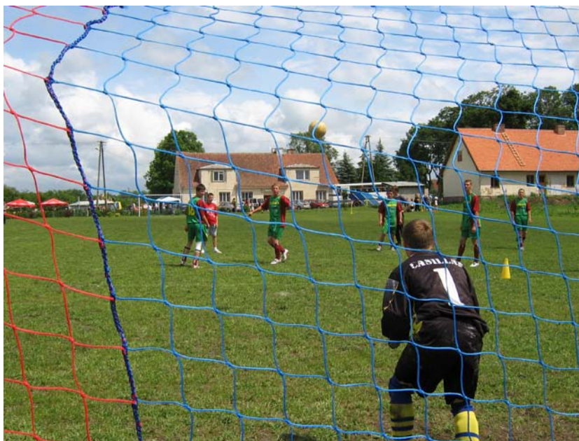
Fot. 12. Drużyna FC Węgielsztyn na boisku wiejskim

Miejscowość posiada drużynę piłki nożnej FC Węgielsztyn- skupiającą młodzież z pobliskich miejscowości. Organizowane są rozgrywki Węgorzewskiej Ligi Sołeckiej oraz turnieje jednodniowe. Staraniem lokalnej społeczności powstało w centrum wsi boisko, na którym rozgrywane są imprezy sportowe i kulturalne o zasięgu powiatowym.