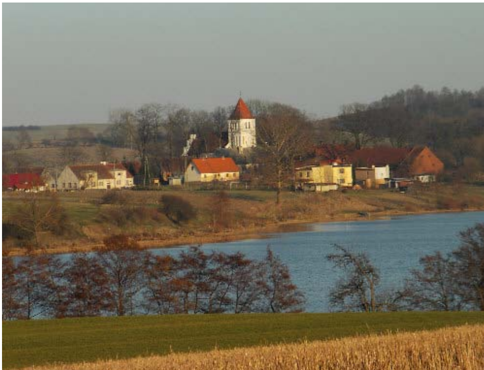
Fot. 6. Widok kościoła od strony jeziora

Szkoła powstała zaraz po wprowadzeniu reformacji w Prusach, tj. po 1525 r. W 1858 r. posiadała ona dwie klasy z dwoma nauczycielami, uczęszczało do niej wówczas 101 uczniów. W 1935 r. szkoła ta nadal zatrudniała tylko dwóch nauczycieli i miała 104 uczniów.