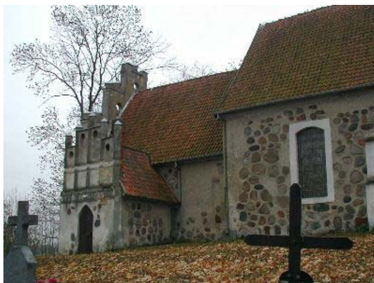
Fot. 9. Najstarsza część kościoła

Węgielsztyn posiada kilka zabytków architektonicznych. Kościół ewangelicki, obecnie parafia rzymskokatolicka p.w. św. Józefa pochodzi z XV wieku i jest zabytkiem II kategorii. W wieku XVIII dobudowano do świątyni część zachodnią z wieżą wysokości 32 m. Kościół jest murowany z kamienia polnego, otynkowany, jednonawowy, orientowany, z dachem dwuspadowym krytym dachówką. Zakrystia pochodząca z XV wieku ma sklepienia beczkowe, nawa jest sklepiona kolebką. Z wystroju wnętrza pochodzą z XVII wieku: ambona posiadająca ornamentykę niderlandzką, krucyfiks w kruchcie i zamek w drzwiach zakrystii. W środku zachował się barokowy ołtarz. Natomiast z czasów krzyżackich pochodzi granitowa chrzcielnica kościoła. Na wieży znajduje się chorągiewka z datą 1714. Katolicy przejęli świątynię w 1946r.