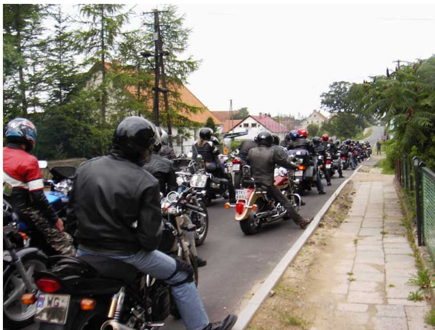
Fot. 8. Turyści wzdłuż drogi przebiegającej przez Węgielsztyn

całości ukończonej i działającej śluzy Piaski w Gui Przed śluzą koryto przegradza jaz, nad jej dolnymi wrotami zbudowano most z drogą, obok stoi budynek – strażnica. Można się nawet umówić na pokaz działania śluzy. Przez Węgielsztyn prowadzi Szlak prowadzący do rezerwatu Siedmiu Wysp (72.2 km) Węgorzewo- Węgielsztyn- Śluza Guja- Leśniewo- Srokowo- Bajory Małe- Wyskok- Mała Guja- Wesołowo- Pasternak- Łęgwarowo- Olszewo Węgorzewskie- Pawłowo- Czerwony Dwór- Węgorzewo.