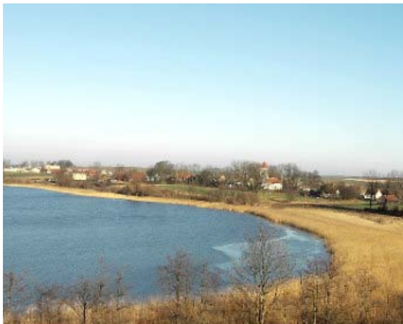
Fot. 2. Panorama Węgielsztyna

Pierwotną ludność Węgielsztyna stanowili Prusowie, o czym świadczy nazwa wsi będąca zarówno w polskiej jak i niemieckiej wersji (Engelstein) przekruceniem nazwy staropruskiej. W 1540 r. mieszkało tu 27 rodzin, wśród których nie było ani jednej niemieckiej, natomiast – sądząc z brzmienia nazwisk – kilkanaście rodzin polskich. Wkrótce potem ludność pruska wsi uległa całkowitej polonizacji.