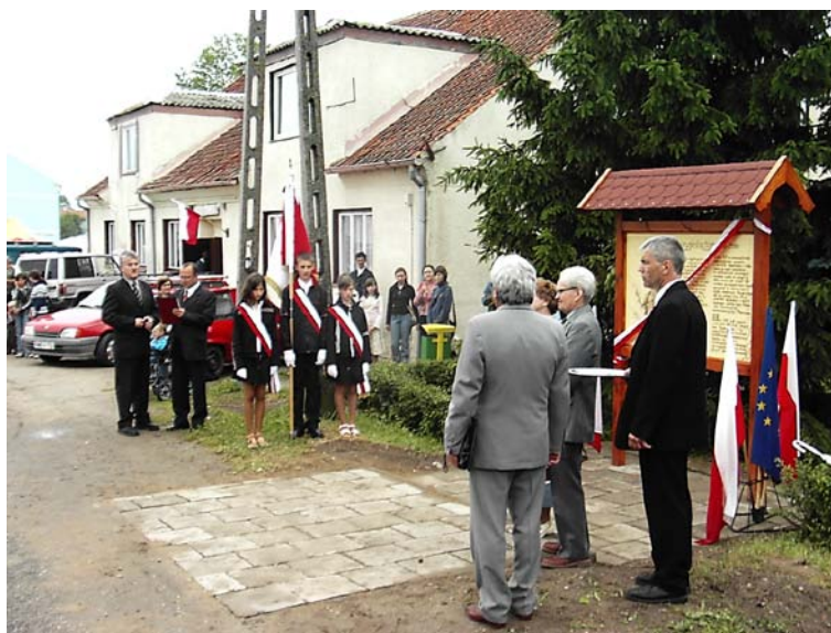
Fot. 10. Budynek świetlicy wiejskiej

Główny obiekt w centrum wsi jest świetlica wiejska wymagająca kapitalnego remontu. Przy świetlicy stoi tablica upamiętniająca 600-lecie miejscowości.