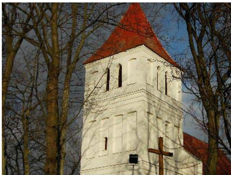
Fot. 4. Wieża kościoła w Węgiersztyńie

Mała, Guja, Klimki, Perły, Przystań, Rydzówka, Stawki i Wesołowo. Od XVII wieku odprawiano tu nabożeństwa w językach polskim i niemieckim. W 1740 r. było 1230 polskich i 510 niemieckich parafian, a w 1806 r. 1245 polskich i 1085 niemieckich. Jednakże spis z 1858 roku rejestrował już tylko 77 Polaków obok 3342 Niemców. Jeszcze w 1890 r. odprawiano tutaj niekiedy nabożeństwa polskie. Według statystyki kościelnej z 1896 r. Polaków w parafii węgiersztyńskiej już nie było.