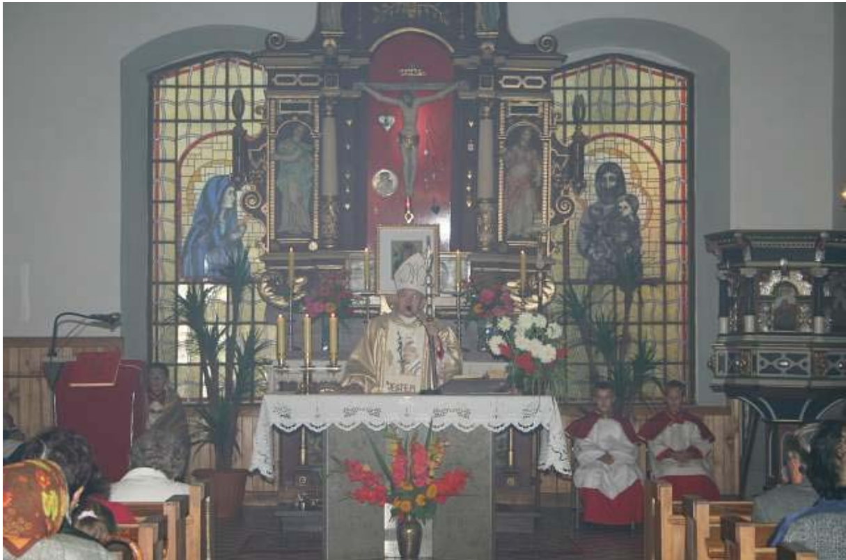
Fot. 5. Wnętrze kościoła – ołtarz i ambona